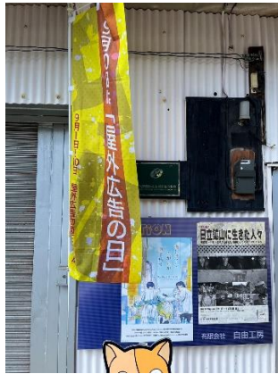
株式会社自由工房様