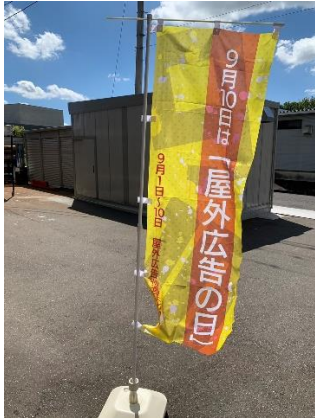
株式会社ヤグチアート様

毎年9月は屋外広告の月間により全国で催しが行われておりますが、茨広美においては、日広連からの「ポスター」との茨広美オリジナルの「ぼり旗」を各事業所に配布、掲示しました。皆様、ご協力ありがとうございました。